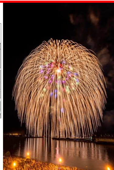
【特別観覧エリアからの眺め】